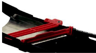
tloučka 4 mm

Před vložením epele Julie nastavte korekci tloučky na 0. Stiskněte zábradlí epele, abyste epele zasunuli dovnitř nebo ven Julie.