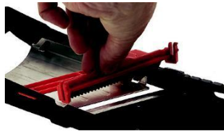
Vložte Julienne epele do mandoliny